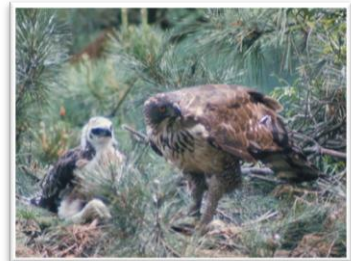
-クマタカの親子- 認定森林：道田山林

フォレストック協会は、森と企業と消費者の皆さまを結び、豊かな森づくりに取り組んでおります。