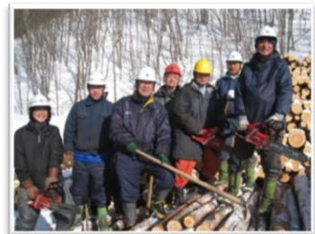
- 葛巻町森林組合の皆様 - 認定森林： 葛巻町森林組合の管理森林