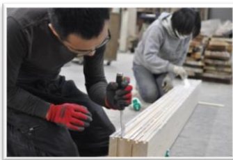
- 工房にて - 認定森林：西粟倉村山林