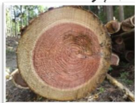
- スギ伐倒木の末口 - 認定森林：材惣の森