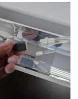
④UVC灯をソケットから取り外す ※ソケットのピン穴が4つござりますが、どの向きで刺しても問題ございません。