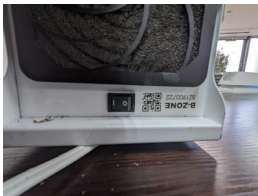
①本体の電源を切る