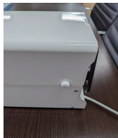
②周囲にある6か所のビスを取り外す